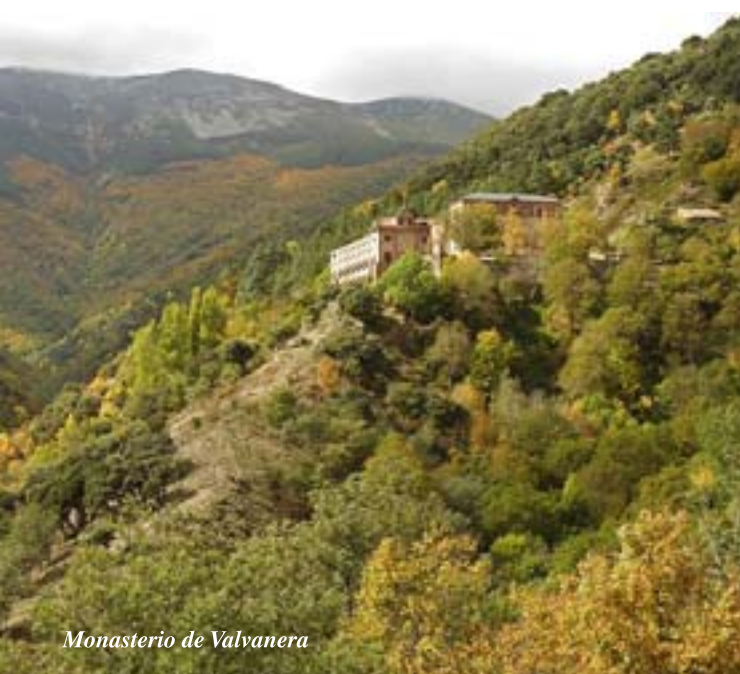
Monasterio de Valvanera

Encinar montano, hayedo, bosques mixtos con grandes arces y fresnos, robles rebollos, abedules y pinar de silvestre.